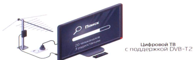
Цифровой ТВ с поддержкой DVB-T2

Если Ваш телевизор в процессе настройки не принимает цифровой сигнал, необходимо подключиться к кабельному либо спутниковому телевидению.